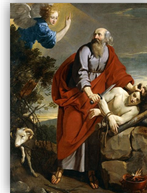
Abraham sur le point d'immoler Isaac

Abraham avait attaché Isaac au bûcher, il élevait le couteau pour le sacrifier quand l'ange de Dieu lui apparut : « Abraham, Abraham ! N'étend pas la main contre l'enfant ! Ne lui fais aucun mal ! Je sais maintenant que tu crains Dieu ; tu ne m'as pas refusé ton fils unique. » Alors, dans un buisson, Abraham vit un bélier, il l'offrit en sacrifice à la place de son propre enfant. Quand toutes les prières furent terminées, Isaac put rentrer joyeusement avec son père Abraham, tous deux vécurent encore longtemps et eurent beaucoup d'enfants.