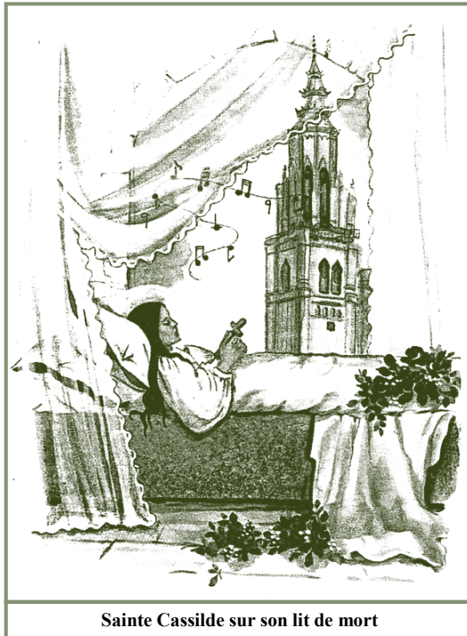
Sainte Cassilde sur son lit de mort

Sainte Cassilde meurt pieusement à Briviesca. Les cloches se mettent à sonner toutes seules pour annoncer son entrée au paradis. Elle obtient de nombreux miracles après sa mort ; on l'invoque pour obtenir des guérisons et pour la conversion des musulmans. L'Église célèbre sa fête le 9 avril.