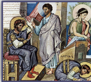
Le roi David se prosterne en signe de pénitence

Le roi David s'indigna et s'écria : "Je veillerai à ce que ce méchant soit puni." Nathan lui répondit : "Ce méchant, c'est toi. Tu as fait tuer un pauvre homme et tu lui a pris sa femme."