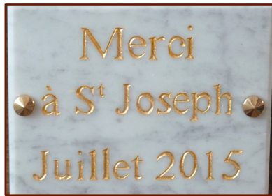
Un ex-voto est une tablette de pierre, généralement exposée dans une église, qui témoigne et remercie Dieu ou un saint pour certaines grâces reçues.

Ainsi toute ta journée sera unie au bon Dieu comme une véritable action de grâce. ■