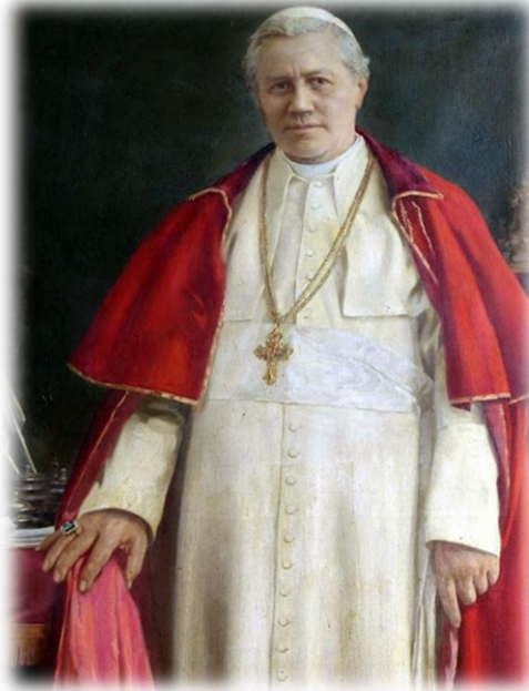
Le pape Saint Pie X, Patron céleste de la Fraternité Sacerdotale Saint-Pie X

Pensez donc ! Le démon n'a pas aimé ! Il a tout fait pour faire supprimer l'œuvre de cet évêque catholique. En 1976, le pape a voulu punir Monseigneur Lefebvre et en 1988 il l'a même excommunié.