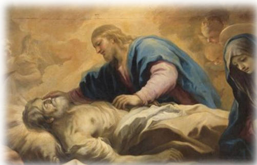
Saint Joseph, est le patron de la bonne mort car il est mort entouré de Jésus et de Marie.

C'est donc une bonne chose de prier pour ces personnes afin que le Bon Dieu leur donne la grâce de faire un bon acte de contrition, d'avoir une bonne pensée. Priez aussi pour vous, chers Croisés, pour que votre dernière heure se passe entre les mains de la Très Sainte Vierge, afin qu'elle vous aide à être bien prêt en cet instant suprême. ■