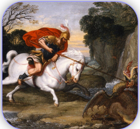
Saint Georges combat le dragon

Tout comme une mère rassemble ses enfants dans la maison familiale, l'Église doit gagner ces ennemis par notre exemple. Par nos sacrifices, nos œuvres de charité, notre grand amour du prochain, en persévérant dans notre devoir d'état, si humble soit-il, nous participons au triomphe de l'Église. ■