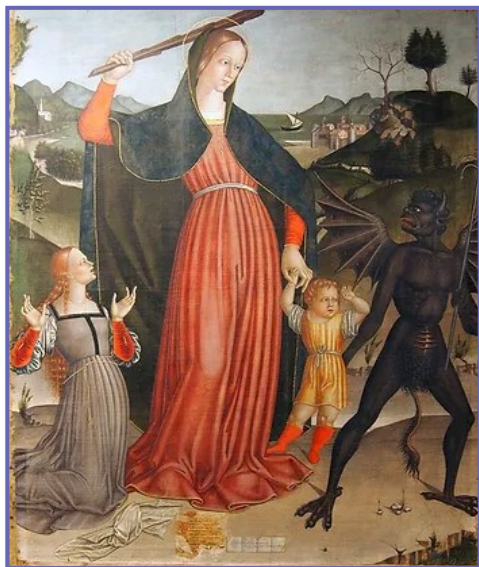
Notre-Dame protège ses enfants du démon. L'Église fait de même.

Chers Croisés, par votre baptême, vous faites partie de l'Église. Gardez donc dans votre cœur cette belle espérance que nous laisse Jésus et priez pour que l'Église triomphe de ses ennemis en les convertissant ! ■