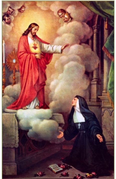
Notre-Seigneur apparaît à Sainte Marguerite-Marie

Elle a été béatifiée le 18 septembre 1864 et canonisée le 13 mai 1920 par le pape Benoît XV. ■