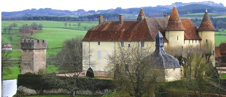
Le château de Corcheval où Marguerite-Marie promet de se donner toute à Dieu

En grandissant, elle oublie un peu sa promesse de se donner à Dieu. Mais quand son oncle et son frère décident de la marier, elle résiste avec force et leur explique qu'elle veut se donner au bon Dieu et entrer chez les Visitandines.