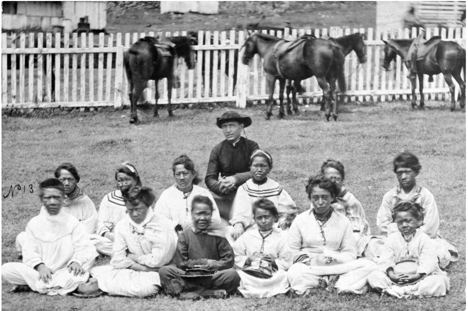
Le Père Damien avec des jeunes filles lépreuse de Molokai

Le Père Damien a laissé passer de nombreuses occasions de quitter Molokai, toujours zélé pour gagner des âmes au Christ. Il écrivit à son frère : « Les gens me plaignent et me trouvent malheureux, mais je me considère comme le plus heureux des missionnaires. » Le sacrifice de Damien était une incarnation de celui du Christ : « Il n'y a pas de plus grand amour que de donner sa vie pour ses amis. » (Jn 15, 13) ■