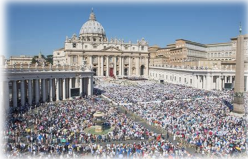
Catholiques priant à saint Pierre de Rome

gens se moqueront de nous, qu'ils ne comprendront pas. C'est ce qu'on appelle le respect humain. C'est un péché parce qu'il nous fait cacher la vérité que nous devons montrer aux autres.