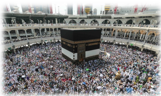
Des musulmans priant devant une idole

Alors, chers Croisés, priez pour tous les enfants de votre âge qui n'ont pas le bonheur de connaître Jésus. Demandez à Notre-Dame qu'elle éclaire leurs âmes et leur fasse connaître son Fils bien-aimé. ■